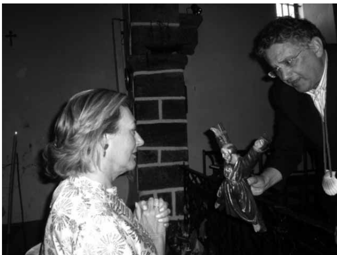
Cumpliendo el ritual de besar la reliquia de S. Andrés