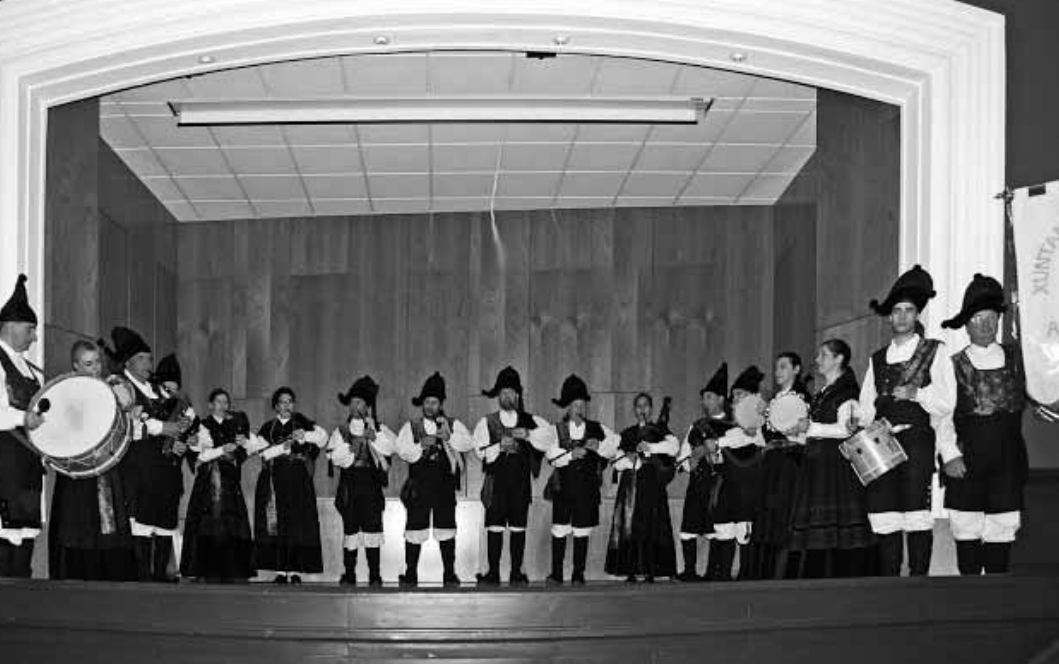
La actuación de los gaiteros amenizó la Jornada de los Amigos de la Cultura Celta en la Universidad de Ávila

muceta, beca y colgante celta. Todo ello por ser un profundo conocedor de la "Cultura de La Tenne" y por haber participado activamente en diversos actos organizados por la Orden de la Vieira, como la presentación de un libro, en la Casa de Galicia, sobre cultura celta.