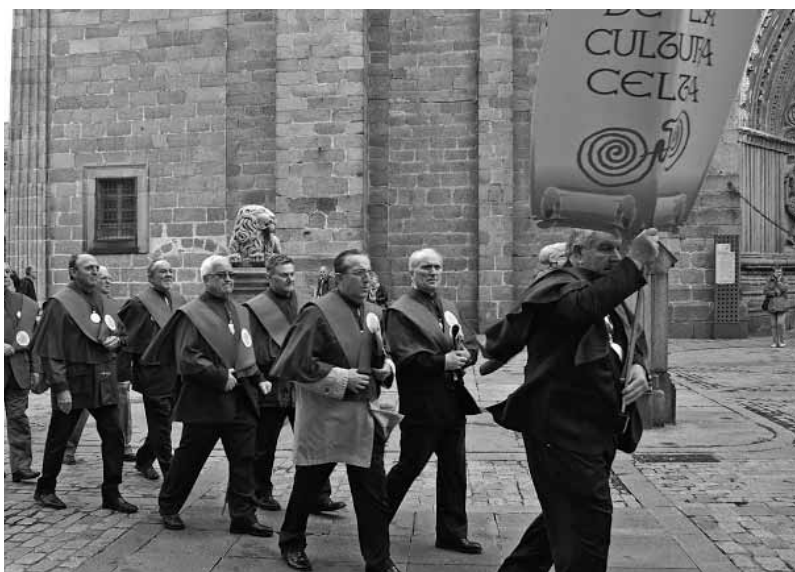
Desfile por las calles de Ávila